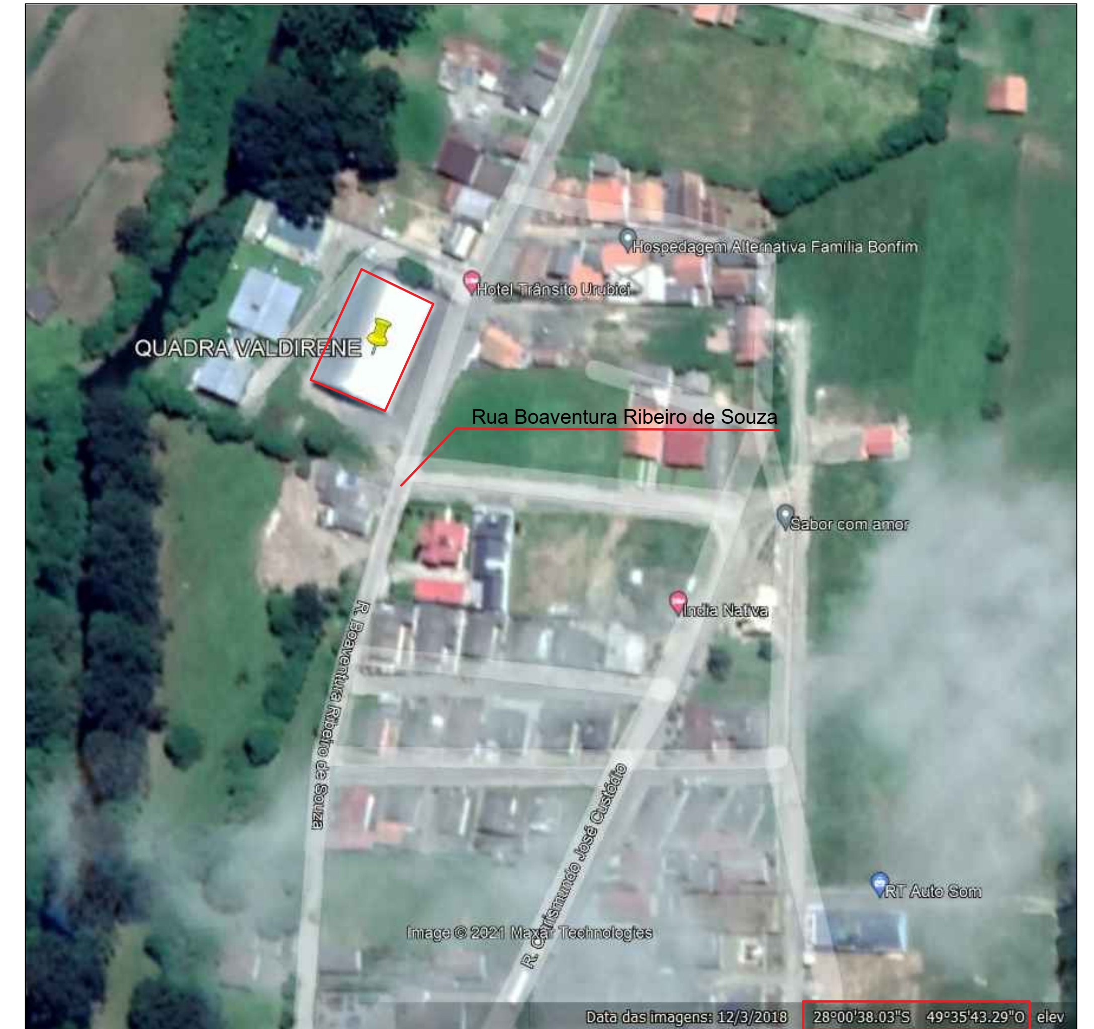
PLANTA DE LOCALIZAÇÃO ESCALA S/E