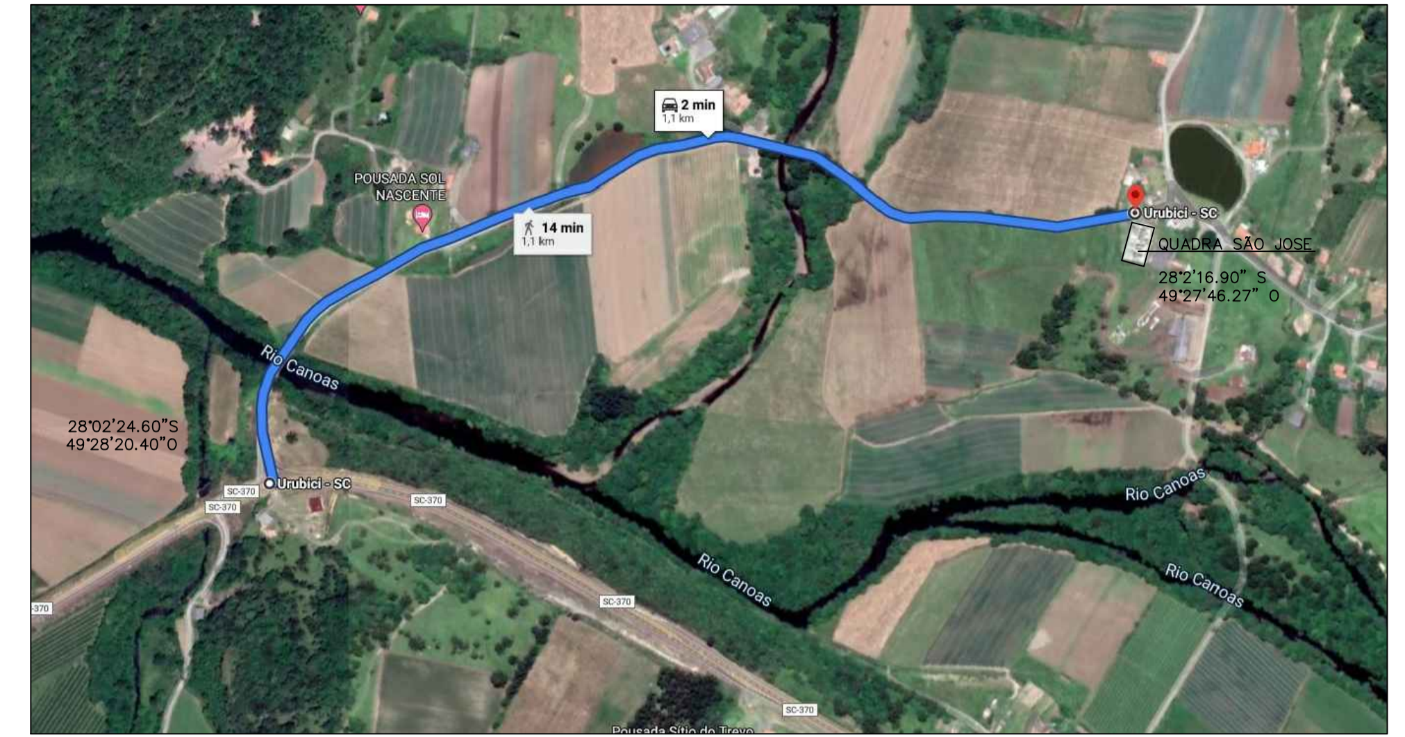
SITUAÇÃO ESC.: S/E