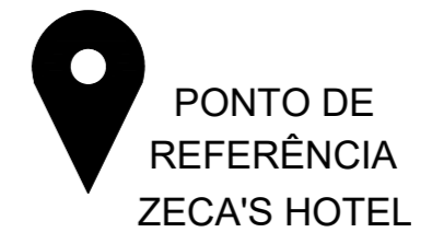
PLANTA DE SIT. E LOCALIZAÇÃO 1:300

NOTA - NÃO POSSUI EQUIPAMENTOS COMUNITÁRIOS PRÓXIMOS A ÁREA DE INTERVENÇÃO.